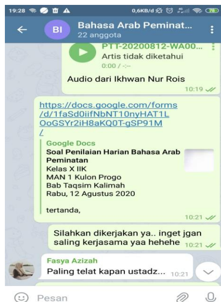
Gambar 4. Evaluasi Materi Taqsim Kalimah

Tahap penutupan ini, guru juga membagikan bentuk evaluasi pembelajaran. Hal ini bertujuan untuk mengetahui tingkat pemahaman materi yang telah diajarkan pada pertemuan tersebut, yang mana bentuk evaluasi ini berupa tugas mandiri yang dikerjakan melalui layanan google form .