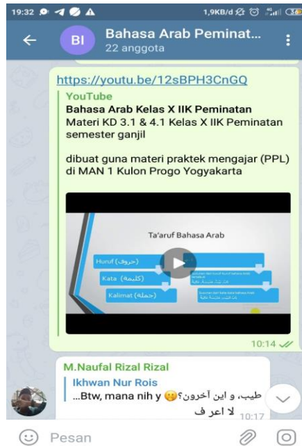
Gambar 3. Materi Bahasa Arab Kelas X IIK